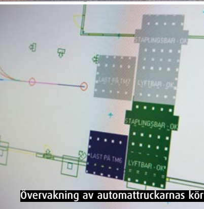
Övervakning av automatruckarnas körvägar i magasinen.