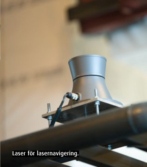
Laser för lasernavigering.