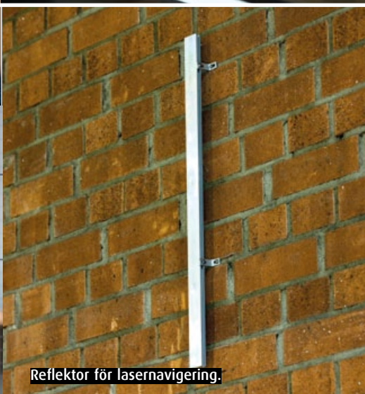
Reflektor för lasernavigering.