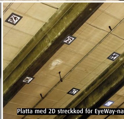
Platta med 2D streckkod för EyeWay-navigering (kamera som är riktad uppåt).