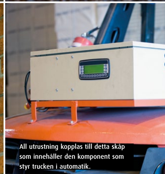
All utrustning kopplas till detta skåp som innehåller den komponent som styr trucken i automatik.